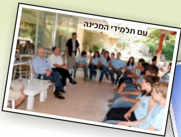
עם תלמידי המכינה