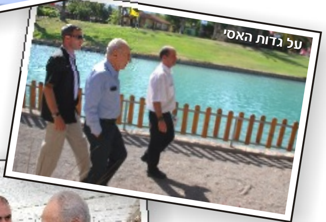
על גדות האסי