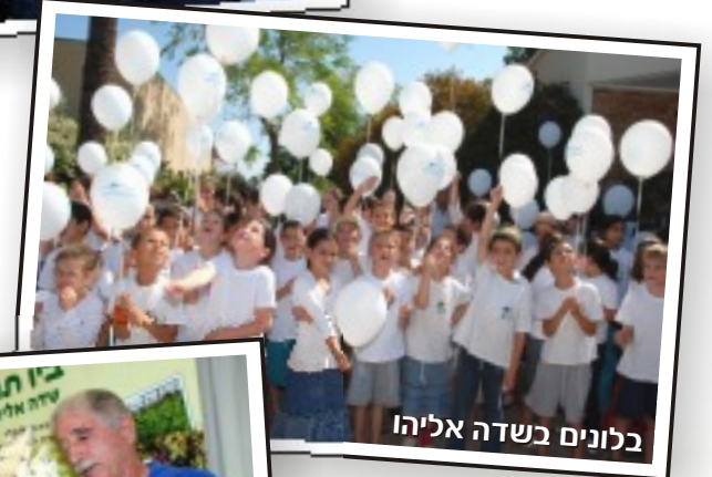
בלונים בשדה אליהו