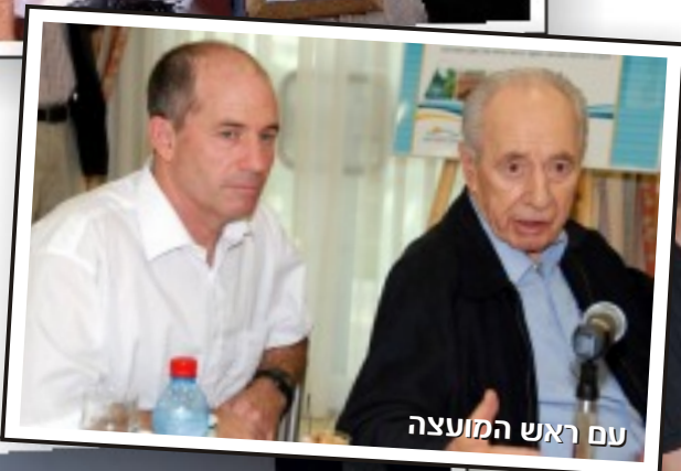
עם ראש המועצה